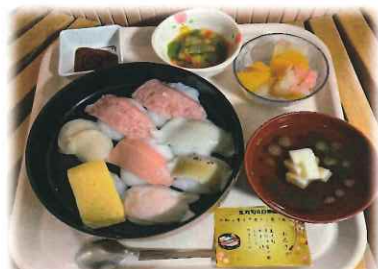
生寿司の日(ミキサー食)